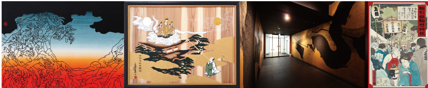
1. 三十三応現身波図-明日への精神- 27/Acrylics on Canvas/240×340/2021 2. 大絵馬「令和元年祈願図」/Acrylics on Wood panel/903×1230/2019(信州善光寺) 3. 間-HAZAMA-/Acrylics on Wall/2018(Park Hotel Tokyo 地下2F エントランス) 4. 「駒形嶽駒弓神社 秋季例大祭」ポスター(駒形嶽駒弓神社之図/Acrylics on Paper/360×240/2021)

2022年春開催のOZ-尾頭-山口佳祐展1ヶ月前プレイベント。 絵画を軸に展開された数々の“もの”を原画と併せて展示。また、奉納大絵馬をはじめ壁画などのパネル展示。会期中はギャラリートークも実施。 4月の本展開催まで、残すところあと1ヶ月。本展とは異なる視点から、作家の絵画を見ることができるかもしれません。